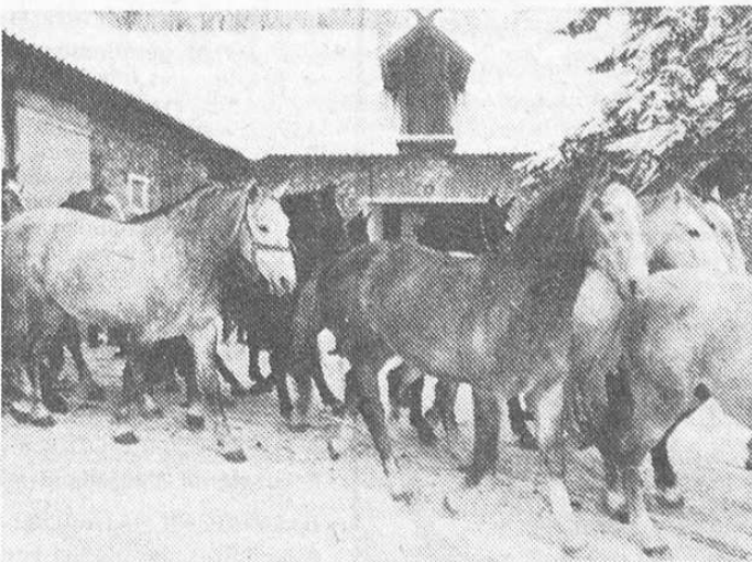
Szabad az út, indulhat a ménés...

— Az ötvenes évek elején, Bábólnáról hajtották ide a ménest. Mint kiderült, ez a mézsköves, dombos, száraz terep kitűnő környezet e faj számára. Olyannyi-