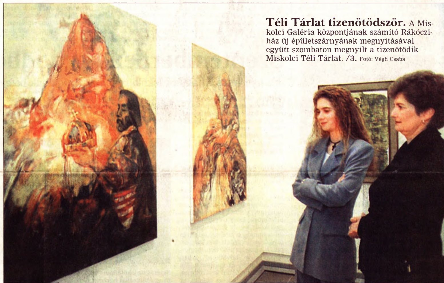
Téli Tárlat tizenötödik. A Miskolci Galéria központjának számító Rákóczi-ház új épületszárnyának megnyitásával együtt szombaton megnyílt a tizenötödik Miskolci Téli Tárlat. /3.

Miskolc (ÉM - FL) - Borsod-Abaúj-Zemplénben nincs jelentősebb terület belvíz alatt - közölte az Észak-magyarországi Vízügyi Igazgatóság (ÉVIZIG) belvizes ügyelete. A szokatlanul korán és nagy mennyiségben lehullott hó viszonylag lassan olvadt és csak foltokban okozott belvizet. A Bodroghözben mintegy 1500, Dél-Borsodban, Mezőkövesd, Tiszavalk, Tiszabábolna környékén 1000 hektárt borít belvíz. A fentiek következtében az ÉVIZIG részéről belvizes védekezésre nincs ok - közölte az ügyeletes.