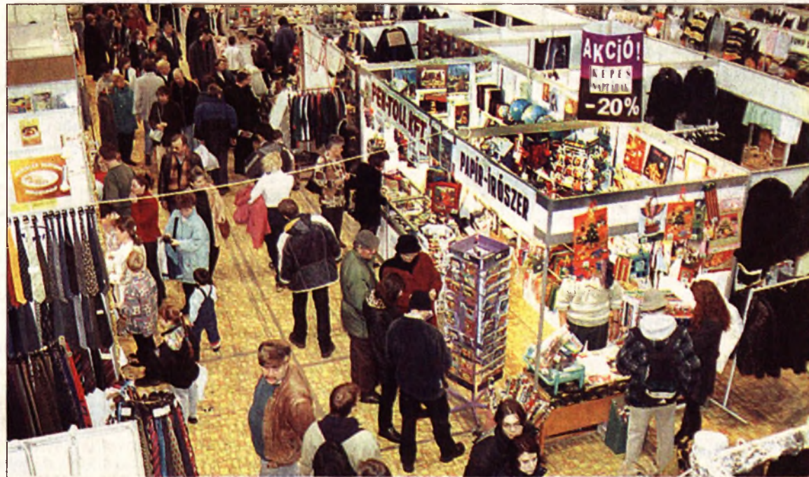
Aranyvasárnap - változó forgalommal. Karácsonyhoz közeledve minden kereskedés teljes mellbedobással hajt a vásárlókért. Azok között pedig - az aranyvasárnapi tapasztalatok szerint - nem mindenki lehetséges, nem mindenki fizetőképes vevő. /2