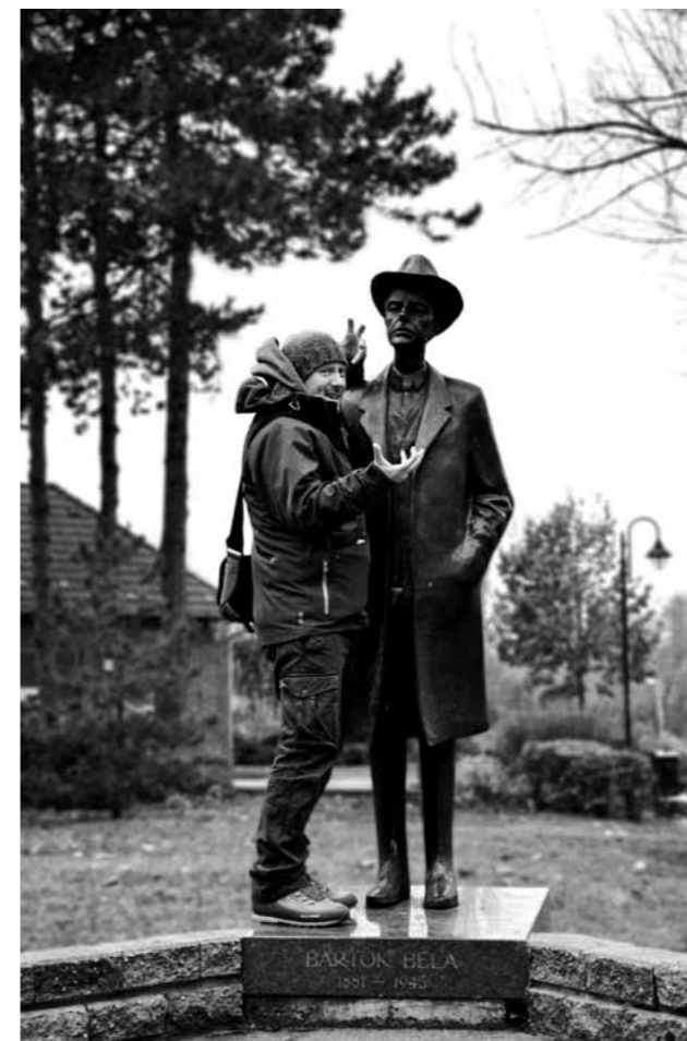
Barbély Virág munkája