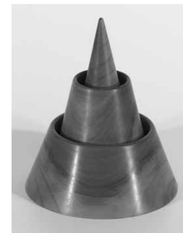
Budahelyi Tibor: Tatlin és én

A 80-as években Ádám művészetét érzéssel teli vonalak expresszív formái jellemezték. Folyamatosan stabilizálódott fiatalos gesztusfestészet, amelyből a zöld szín ki volt zárva, habár itt-ott megjelent képeiben egy-egy zöld felé hajló hangsúly, amire ő maga sem talált magyarázatot. Hibának tartotta, de nem korrigálta. Talán kokettált vele? Soroksáron, a kerítéseket általában zöldre szokták festeni. Egy látogatáskor arconvágott, már messziről, egy kikirics-sárga kerítés, Ádám szülőházának kerítése. Egyedülálló gyönyörű sárga, az uniformisan zöld struktúrák között. Megállapítottam, hogy e sárga szín mögött, fejlett individuális egyéniség rejlik. A képei felépítésére kellett gondolnom: sárga vonalak, amik élénk struktúrát képeznek.