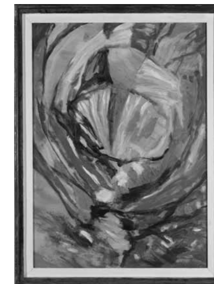
Frömmel Gyula: Két hurok hálójában