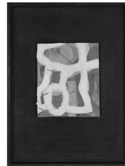
Vankó István: Felülírás